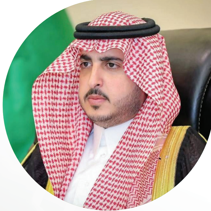
الأمير فيصل بن نواف بن عبد العزيز آل سعود أمير منطقة الجوف